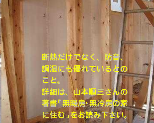
断熱だけでなく、防音、調湿にも優れているとのこと。詳細は、山本順三さんの著書「無暖房・無冷房の家に住む」をお読み下さい。