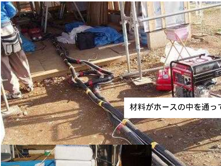
材料がホースの中を通っていきます。