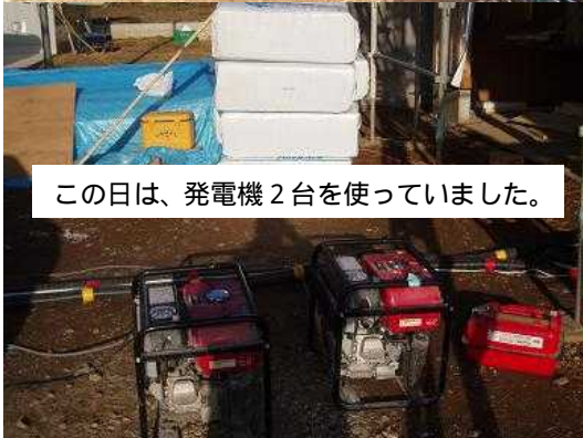
この日は、発電機2台を使っていました。