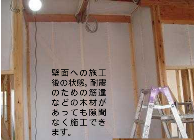
壁面への施工後の状態。耐震のための筋違などの木材があっても隙間なく施工できます。