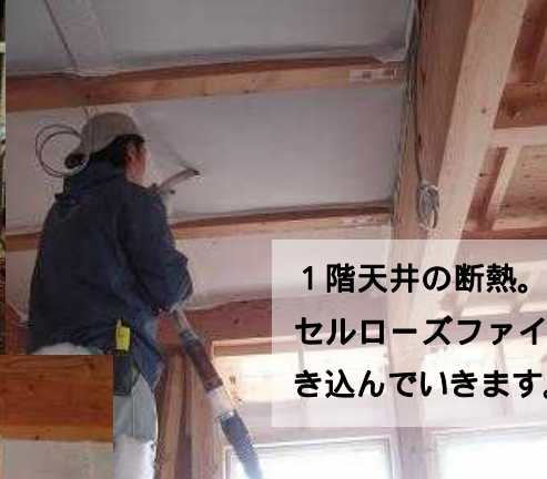
1階天井の断熱。布の中にセルローズファイバーを吹き込んでいきます。